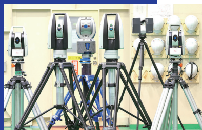
■ 移動式レーザートラッカー