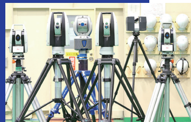
■ 移動式レーザートラッカー